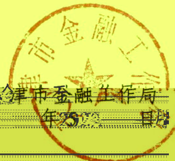
天津市金融工作局