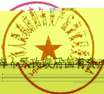
天津市人民政府国有资产监督管理委员会